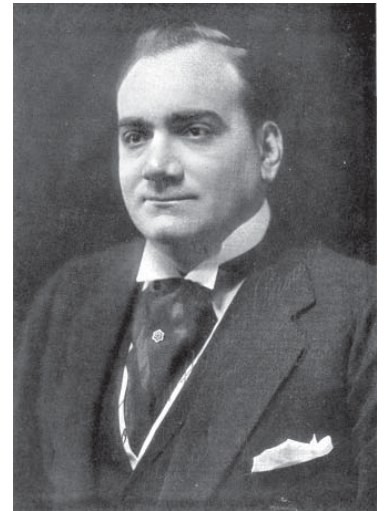
Enrico Caruso alrededor de 1915.

Durante la guerra, el cantante realizó con entusiasmo una gran cantidad de obras de caridad, dando conciertos y adquiriendo Liberity Bonds , que se emitían para subsanar los gastos bélicos.