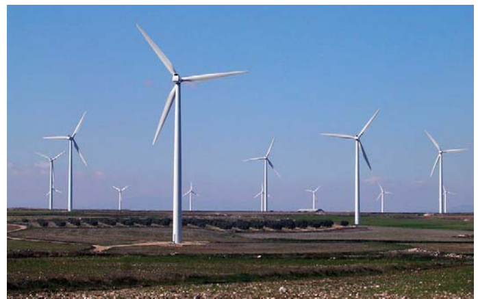
Parque eólico en La Mula, Zaragoza, España

Al igual que España, Alemania cuenta con un sistema de incentivos a la energía eólica basado en primas medioambientales, considerado por la Comisión Europea como el más eficiente de Europa en términos económicos. Los nuevos parques alemanes