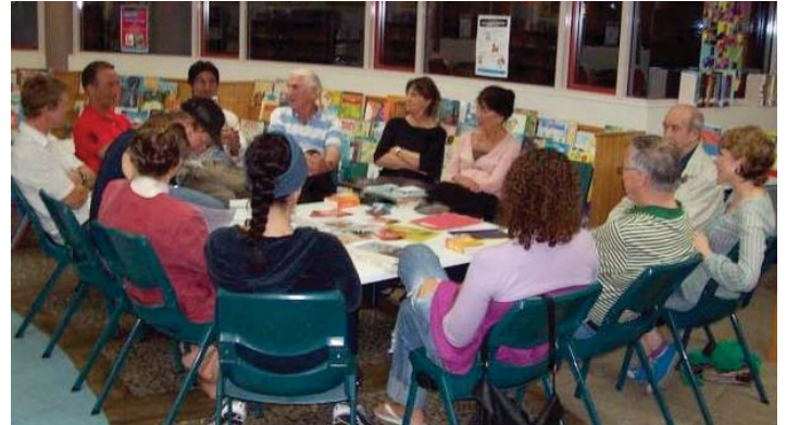
Asistentes a una de las reuniones del grupo.