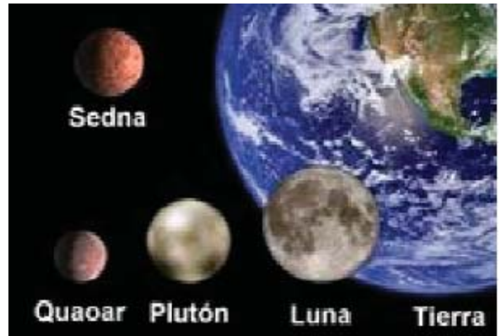
Tamaño de los astros del “Cinturón de Kuiper” y nuestra luna.

El diámetro estimado de Plutón es de 1172 km, con un margen de error de diez Km. Y las mediciones de Eris realizadas en 2005 por Mike Brown, su descubridor, arrojaban para el nuevo objeto un diámetro de cerca de 2400 km. Si Eris era mayor que Plutón, no era lógico que este último siguiera considerándose como un planeta. Además, en aquella remota región de nuestro sistema planetario podría haber decenas de otros objetos del mismo tamaño de Eris, o incluso mayores.