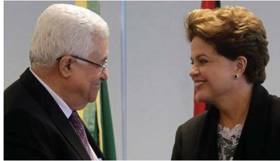
El presidente palestino Mahmoud Abbas con la presidenta de Brasil Dilma Rousseff en el Palacio de Planalto en Brasilia, el día 2 de este mes.

un costo de cientos de miles de vidas inocentes, para encontrar las famosas “armas de destrucción masiva”, que existían en los sueños de George W. Bush. Pero también que enfrentaría y trataría de enmendar el abuso por parte del gobierno de Israel, no solo de invadir las tierras palestinas en 1967, sino el de ignorar las posteriores resoluciones de la ONU y continuar construyendo viviendas para los israelíes en terrenos de legítima propiedad palestina.