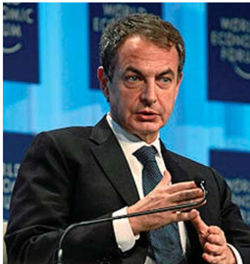
José Luis Rodríguez Zapatero