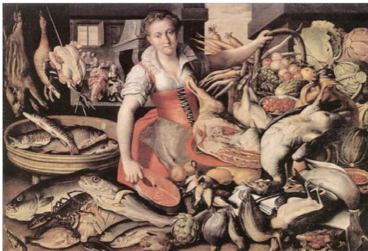
Santa Marta en su cocina (Vincenzo Campi, 1536 - 1591)

Meryl Streep se hizo panadera en It's Complicated (2009) de Nancy Meyers. Graciosas actuaciones de todas las Bridesmaids