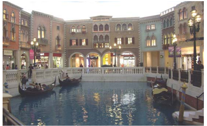
The Venetian. Las góndolas y los edificios son reales. El firmamento no. La foto fue tomada a media noche y sin flash.

Macao es bonito, ¡ánimense! Nunca se sabe, hasta podría ser que algún día cambiaran el invisible letrerito por uno que diga: “¡Los clientes también ganan!” ●