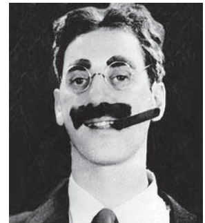
Groucho Marx (1890-1977)

ENCUENTRO QUE LA TELEVISION ES MUY EDUCATIVA. CADA VEZ QUE ALGUIEN LA ENCIENDE, ME VOY A OTRA HABITACIÓN A LEER UN LIBRO.