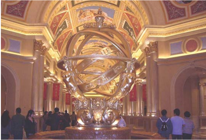
Interior de The Venetian , el casino-hotel más grande del mundo con un costo de miles de millones de dólares.

bles colas de clientes cambiando dinero. Visité algunos sitios turísticos y otros lugares casi vacíos pues resulta que la tal maravilla era el apoltronarse por horas en los miles de metros cuadrados que