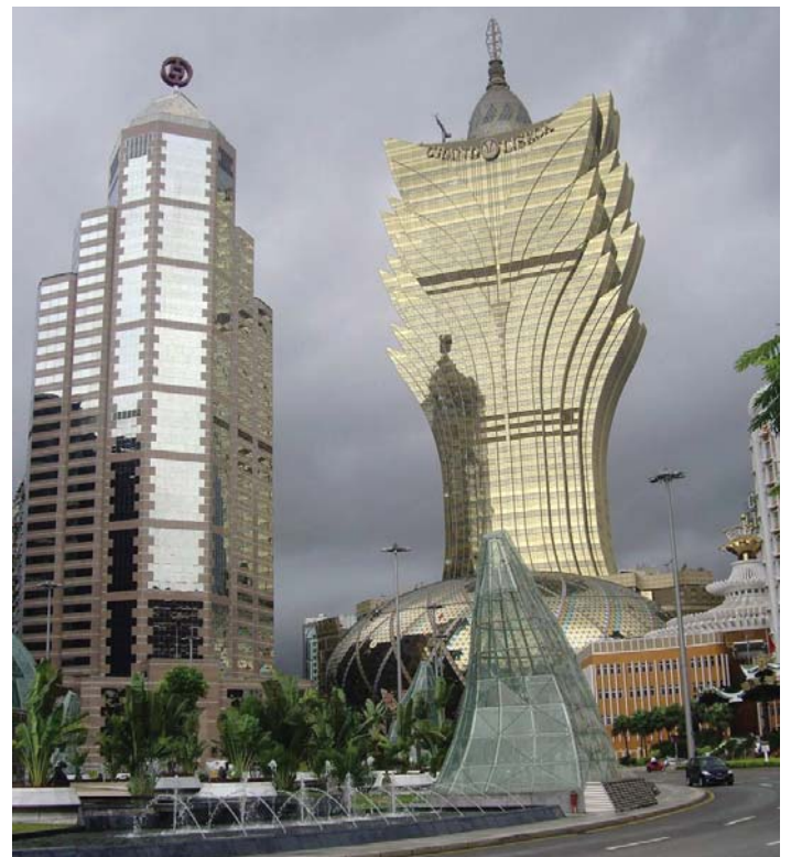
Centro de Macao. A la derecha el “Grand Lisboa” lujosísimo y el segundo casino más grande de la ciudad; en su interior hay un diamante que dicen es el más grande del mundo.

Tienen avisos por todas partes pero en ninguno se lee en ningún idioma uno que diga que la gente va a perder su dinero: ¡cómo se le ocurre! En varios casinos te “regalan” bocadillos pero en los 33 que oficialmente dicen que hay (el amigo patuá asegura que son cientos), te ofrecen té, café y agua. Me metí en la cabeza que estos casinos me debían dinero y les usé los vehículos cientos de veces, me les tomé un té, mil quinientas botellitas de agua y tres cafés. Cuando me estaba tomando el tercer café sentí deseos de cambiar