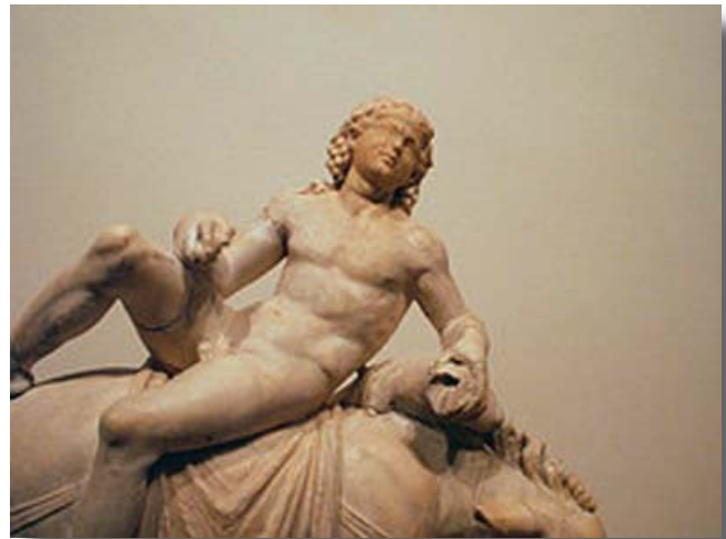
Una de las muchas representaciones del dios griego Dionysos (para los romanos Bachus). La estatua pudo haber sido obra de Praxiteles (400-330 A. C.), aunque muchos escultores posteriores, incluso de la Edad Media, copiaron sus obras.

Sus escritos, muchas veces ingenuos, erróneos y curiosos, no dejan de ser, a veces, verídicos. La palabra vino, creía él, es esta porque apenas terminado de beber, llena las "venas" con sangre . Sobre la vid, apuntó: se denomina vid porque tiene fuerza (vis) para echar rápidamente raíces. En cambio, otros piensan que deben el nombre de vides (vites) a que se entrelazan unas a otras con sus lazos (vitta) y se ligan a los árboles vecinos, por los que trepan. Son flexibles por naturaleza y con sus brazos se aferran a aquéllos con que se entrelazan.