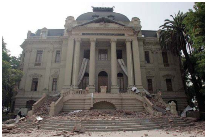
La fachada del Museo de Arte Contemporáneo de Santiago, luego del terremoto que devastó una vasta zona del país.