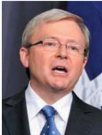
Kevin Rudd, el Primer Ministro que fue traicionado.