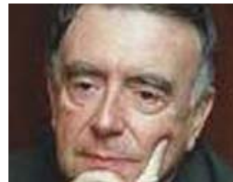
Luis María Anson

Luis María Anson es un periodista y escritor español, miembro de la Real Academia Española, que dirige el suplemento El Cultural del diario El Mundo de España.