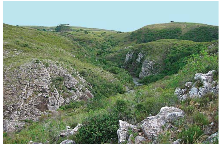
Quebrada de los Cuervos – Dpto. de Treinta y Tres, Uruguay

–Será una úlcera, Raimundo, no una “úrsula” –le dijo el juez – pero además, otra vez estás cometiendo una redundancia.