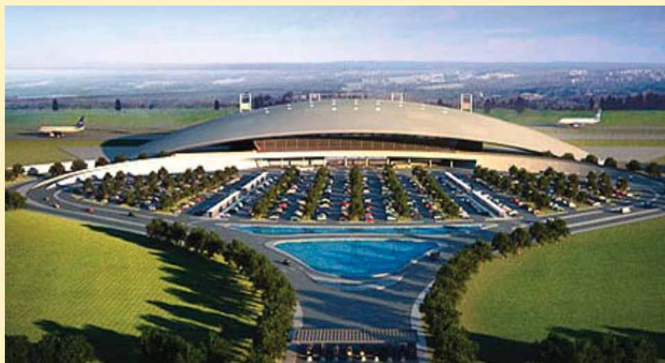
El recientemente remodelado aeropuerto Cesáreo Berisso de la ciudad de Montevideo.