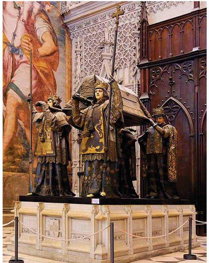
El sepulcro de Colón en la Catedral de Sevilla.

En otras palabras, los restos que se excavaron en 1795, aparentemente en el lado de la Epístola, y después se llevaron a La Habana, pudieran haber sido los de Diego Colón, quien también fuera enterrado en la catedral dominicana. Estudios de ADN llevados a cabo en los restos de Sevilla indican que los mismos son los de un miembro de la familia Colón. Es posible que sean efectivamente los del mismísimo Almirante de la Mar Océana, pero no hay absoluta