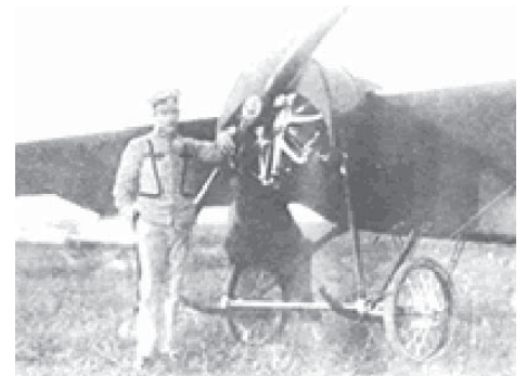
El piloto oriental con el “Montevideo”

De regreso a Uruguay, Berisso no se rindió y fabricó otros dos aviones uruguayos con el mismo modelo que había volado hasta Colombia: el Montevideo 1 y el Montevideo 2 . Nunca alguien repitió la hazaña de diseñar y fabricar un avión en Uruguay y tripularlo hasta Colombia. Y eso fue en 1929. Supongo que es suficiente, aunque queda todavía una historia más.