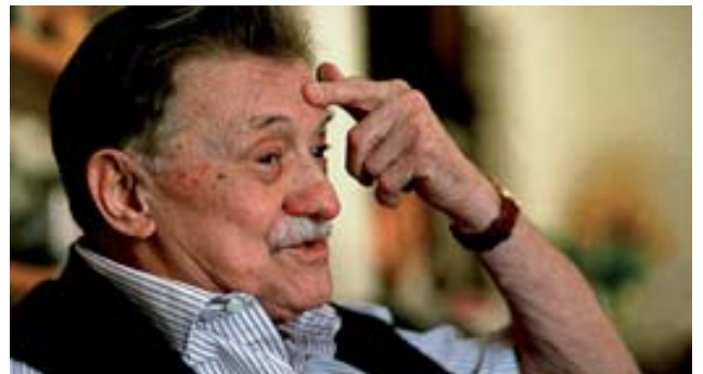
Mario Benedetti en 2005.