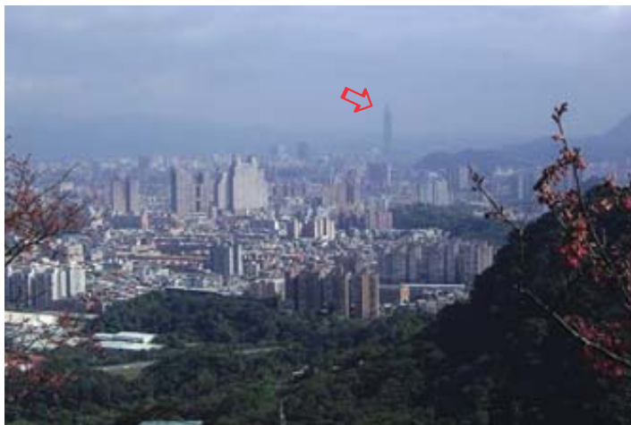
Taipei, la capital de Taiwán, de unos tres millones de habitantes ubicada en la parte nor-occidental de la isla. Foto tomada desde uno de los templos de “la fortuna” en Sansia. Se aprecia al fondo –un tanto difuso– el edificio “Taipei 101” el rascacielos completo más alto del mundo. (flecha)

Él estaba pensando precisamente en esa palabra cuando se disponía a atravesar la calle para recoger un par de libros de la biblio-