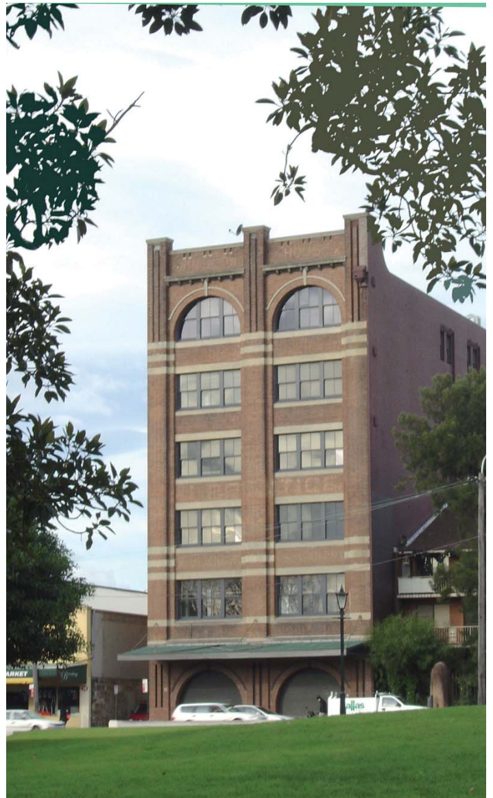
El edificio que ocupará muy pronto el Instituto Cervantes se encuentra en un punto estratégico del centro de la ciudad, a poca distancia de la Universidad de Sydney.

Al mismo tiempo ha habido un mayor interés por parte de muchos australianos jóvenes, en estudiar en serio nuestro idioma, con el propósito de forjarse una carrera, ya sea como intérpretes, diplomáticos o docentes. Es sintomático que algunas universidades han recibido este año una cantidad bastante mayor de matrículas que en años anteriores. Por otra parte, en muchos suburbios de esta ciudad, se han formado grupos de australianos (y de otras nacionalidades) que se reúnen cada se-