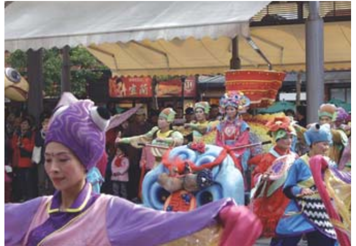
Baile típico de los nativos de Luodon al oriente de Taiwán. Debido a sus parques y sitios interesantes, su población de unos 80 mil se cuadruplica durante las vacaciones y finales de semana.

teca. Las seis chicas de mini-shorts y mini-camisillas lo habían dejado turulato por unos segundos y ahora su mente divagaba entre contestarle a la flaquita o increpar al inculto chofer quien lo empujaba sin preámbulos queriendo abrir, a su costado izquierdo, una puerta pequeñita pero con unos letreros inmensos que decían algo en chino y otro en inglés que traducía “... Súper Modelos...”