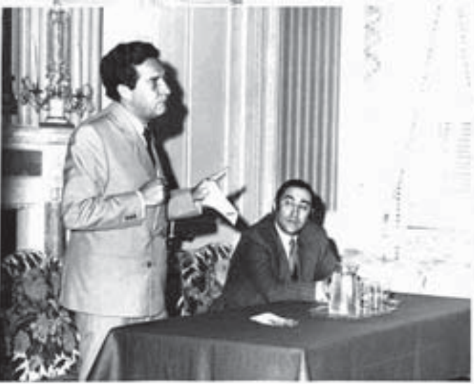
Emir Rodríguez Monegal escucha una disertación de Octavio Paz en un encuentro en Río de Janeiro.

literatura latinoamericana, contribuyendo a llevar a la fama a nombres tales como Guillermo Cabrera Infante, Severo Sarduy y Manuel Puig, así como a difundir la fama internacional de García Márquez, Carlos Fuentes y Mario Vargas Llosa.