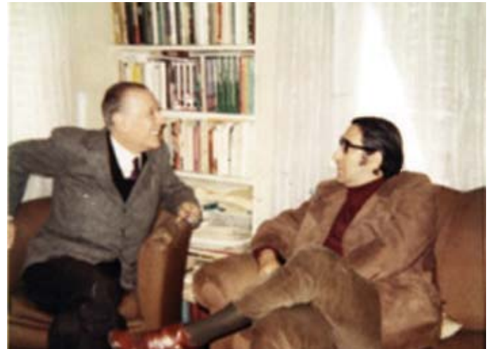
Con Jorge Luis Borges en Buenos Aires (en los años 50).

En la Universidad de Princeton (EE.UU.) existe un volu-