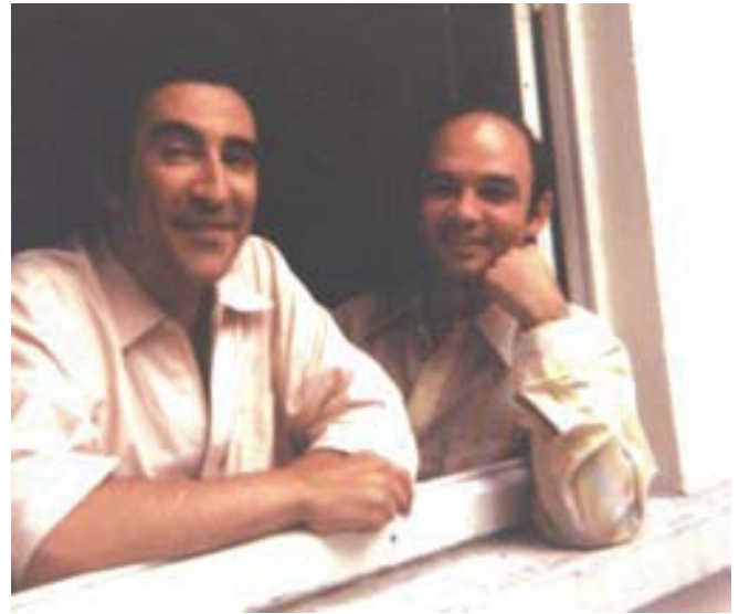
Rodríguez Monegal con el escritor chileno José Donoso en la ciudad de México.