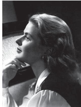
La actriz sueca Ingrid Bergman, quien conquistó Hollywood y los públicos de todo el mundo.

El genio Alfred Hitchcock jugaba con la imaginación visual del espectador. Ejemplos bastamente reconocidos son sus escalofrantes The Birds ( Los Pájaros ), Psycho ( Psicosis ), y muchas más. Las grandes cintas que utilizan altos y caros recursos visuales no dejan al lector nada a su imaginación. Todo ha sido di-