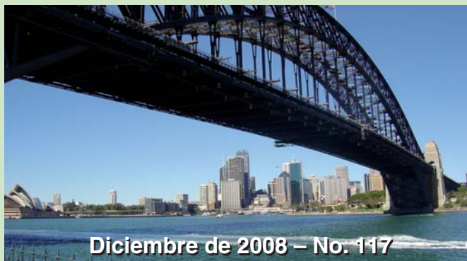
Diciembre de 2008 – No. 117