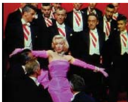
En la foto, Marilyn Monroe en Gentlemen prefer blondes (Los caballeros las prefieren rubias), dirigida por Howard Hawks, ejemplo de Technicolor . 1953.

Los directores, nada menos que Hitchcock, Cukor, Rossetlini, Antonioni, Passolini, Godard, Chabrol, Bertolucci, Truffaut... desplegaban sus alas del negro y blanco al color; del CinemaScope al Eastman Color y al Technicolor . De entre los grandes genios del arte de hacer cine, se encontraba el nombre enigmático y sonoro de Ingmar Bergman.