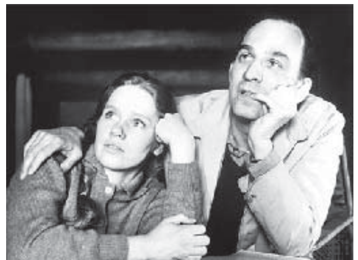
Ingmar Bergman con Liv Ullman, quien fuera su musa y amante; madre de su novena hija y protagonista de nueve películas de Bergman.

El cine nórdico no es un cine para todos los gustos, es un cine para exigentes. Ejemplo de ello son la reciente Lilya 4-ever ( Lylja 4-ever , 2002), impresionante y dolorosa cinta del extraordinario sueco Lukas Moodysson, con la bella rusa Oksana Akinshina; Babette's Feast ( El festín de Babette , 1987), del danés Gabriel Axel, con la francesa Stéphane Audran; Lars von Trier, con Braking the waves , Idioterne ( Rompiendo las olas , Los idiotas ), cineasta danés que iniciara el movimiento Dogma 95 en 1995, el cual intentaba liberar al cine de los esquemas tradicionales de producción. Algunos de los integrantes de Dogma, son: Thomas Vinterberg, con su excelente Festen ( La celebración , 1998) y Susanne Bier, quien se iniciara en Dogma con Brødre ( Hermanos , 2004), para más tarde realizar Efter brylluppet ( Después de la boda , 2006), con el excelente Mads Mikkelsen.