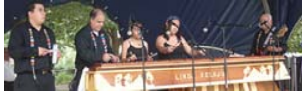
Marimba Linda Xelaju