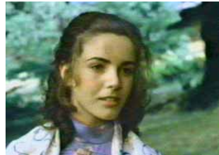
Irma en una escena del filme.

Murphy: Y el promontorio está lleno de profundas “chimeneas”