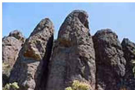
Algunos de los muchos monolitos que se encuentran en el lugar.