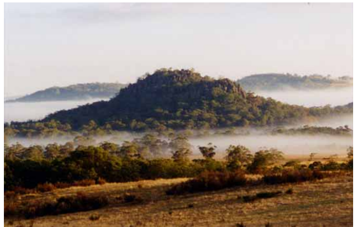
Hanging Rock, originariamente llamado Monte Diógenes. (Foto tomada desde varios kilómetros de distancia).

Nunca se ha llegado a descubrir qué ocurrió realmente, y las especulaciones son diversas, yendo desde que cayeron dentro de una de las chimeneas que contienen algunos de los gigantescos monolitos, pasando porque algo