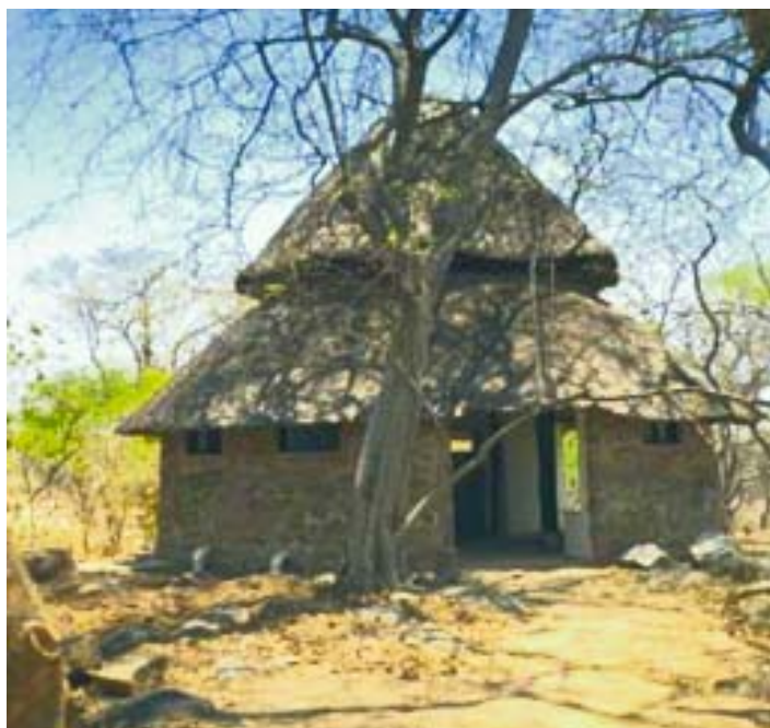
Típica vivienda de Malawi.

Eran las dos de la tarde cuando nos alejábamos –quizá para siempre aunque nunca se sabe– de Malawi rumbo a Sudáfrica para luego continuar viaje a tierra australiana. Es casi imposible trasladar a la realidad de otros las sensaciones, experiencias o simples