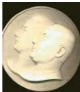
Perón y Evita

cinco años de actuación, no tiene por qué respetar y rendir pleitesías a una manga de críticos teoristas, improvisados, ignorantes, que pretenden subvertir el buen sentido en nuestro país y que yo no tengo ganas de considerar o respetar». (3)