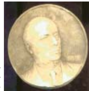
Presidente Luis Batlle