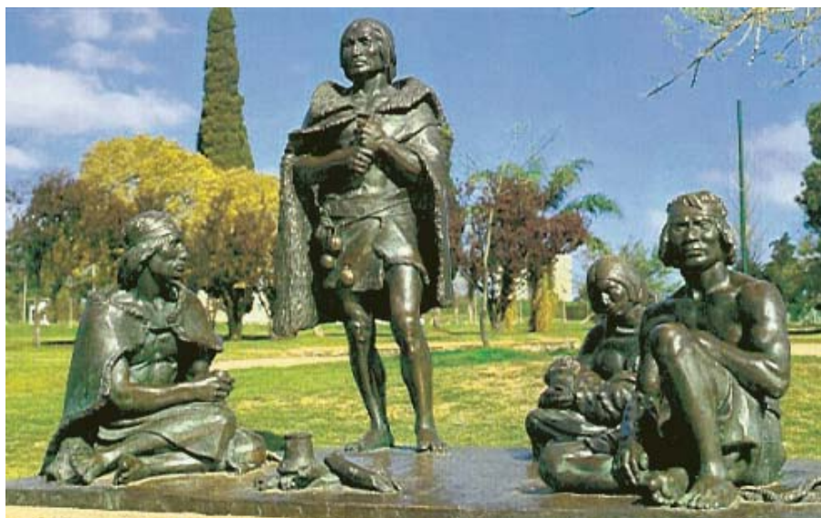
Conjunto “Los últimos charrúas” que Prati realizó en colaboración con otros artistas, se encuentra en el Paseo El Prado de Montevideo.

El Primer Salón Anual de Artes Plásticas, organizado por la Comisión de Bellas Artes, fue realizado en el año 1937, año éste del regreso definitivo de Prati a Uruguay. Con su obra «Torso de Efebo» conquistó la Gran Medalla de Oro en escultura. La medalla de